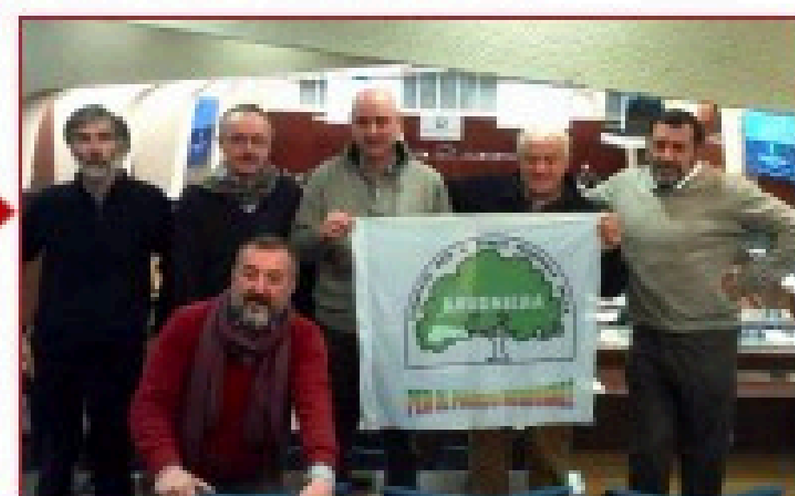
21 dicembre 2017: costituzione del Parco Regionale Groane-Brughiera